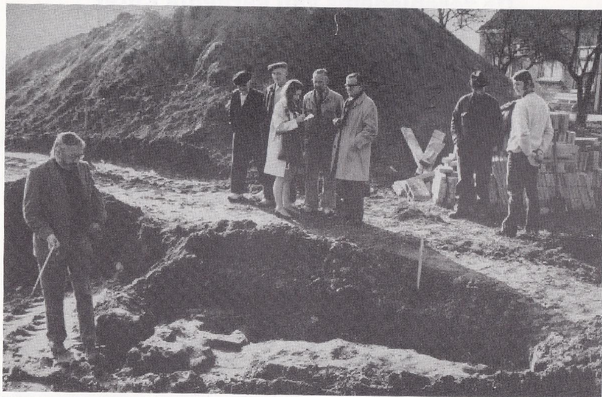
In 1973 werden bij het uitgraven van een fundering de resten blootgelegd van vermoedelijk de in de Spaanse oorlog verwoeste kapelaanswoning.