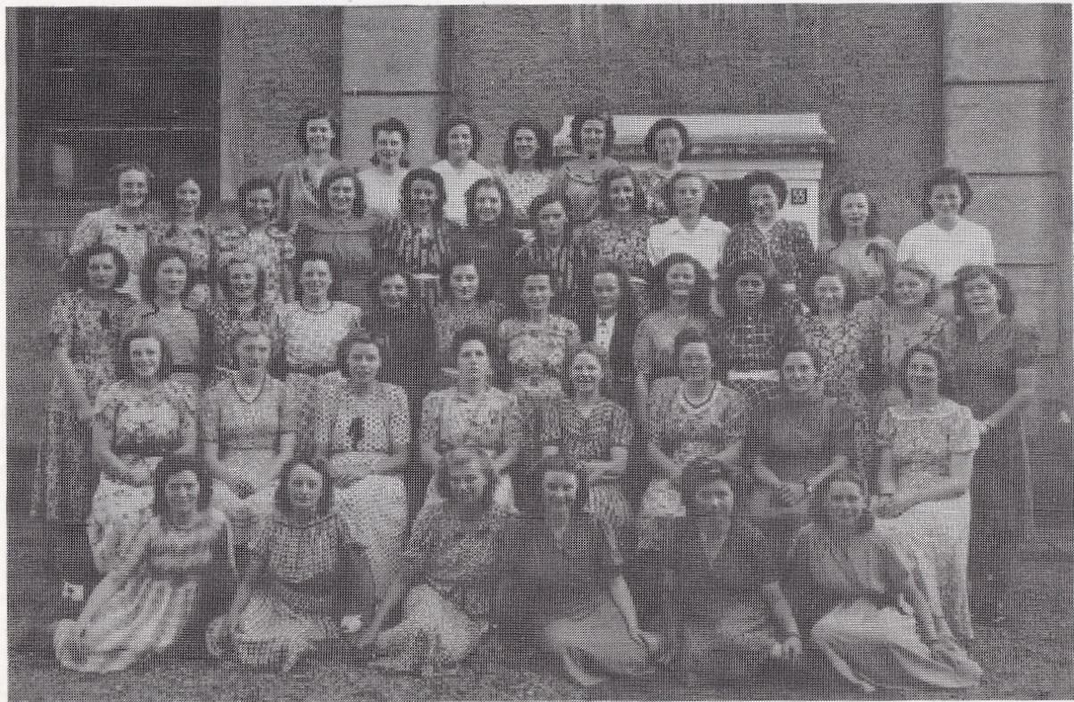
De Meisjesvereniging 'Bidt en Werkt', omstreeks 1948.