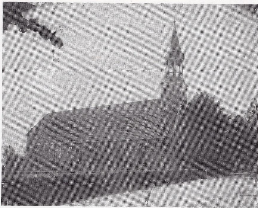
Foto van de R.K. Waterstaatskerk. Boven de ingang is het raadselachtige steentje met het opschrift '1700'.