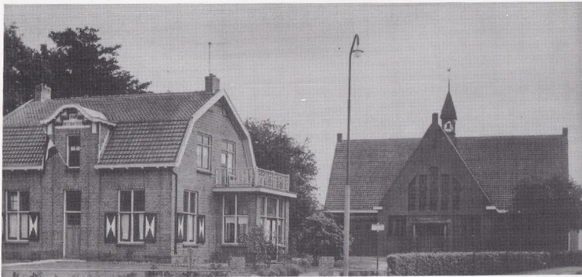
Foto van de Gereformeerde kerk met de oude pastorie.