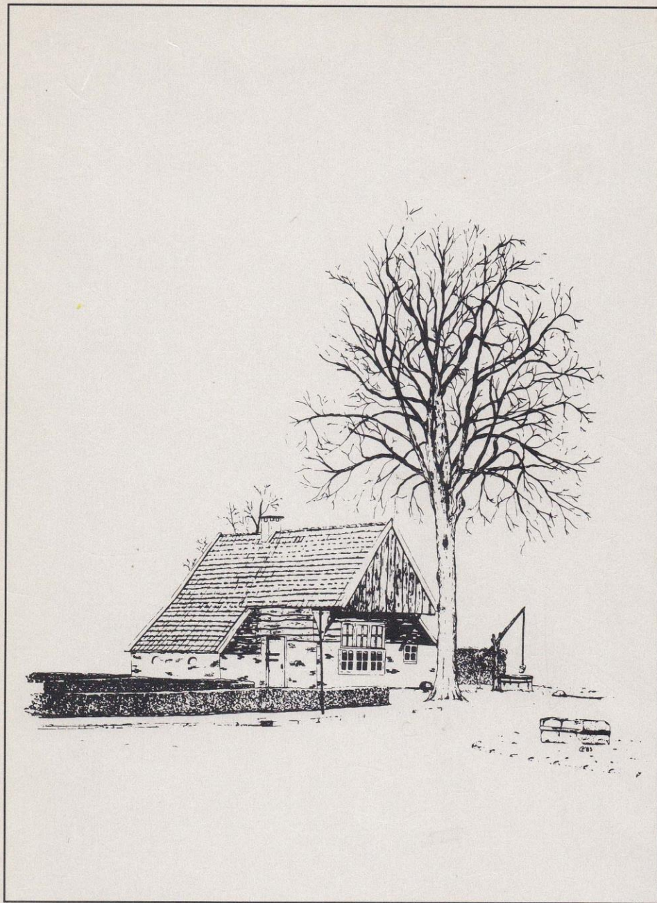
Pentekening: G.M. Pietersma