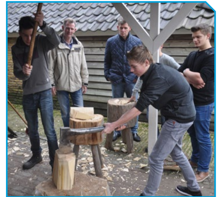
Samenwerking met de lokale ROC heeft ervoor gezorgd dat leerlingen een snuffelstage kunnen doen bij de opleiding handmatig klompenmaken in Enter.

Al met al zijn er genoeg plannen. De bijdrage van de provincie hebben we goed besteed en we zijn als stichting heel blij met het resultaat van alle projecten en evenementen. Vooral over de Promotiedagen waren zowel de bezoekers