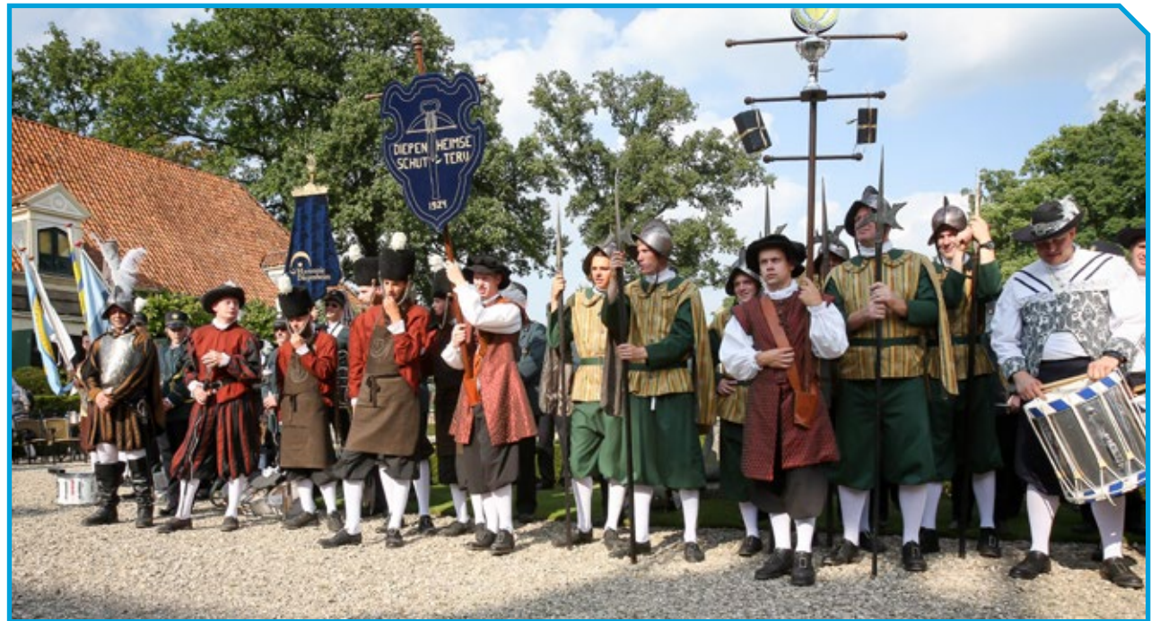
Leden van de Diepenheimse Schutterij bezoeken regelmatig de basisscholen in de buurt om te vertellen over hun traditie, aan de hand van een lespakket.

Andere zaken die we met de bijdrage van de provincie Overijssel hebben gedaan zijn het ver-