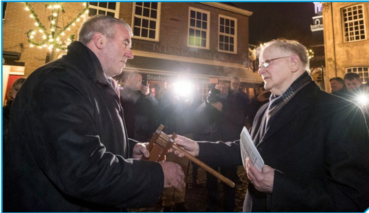
De traditie van de nachtwacht is weer voor jaren verzekerd van voortzetting door het benoemen van een nieuwe nachtwacht in 2016.