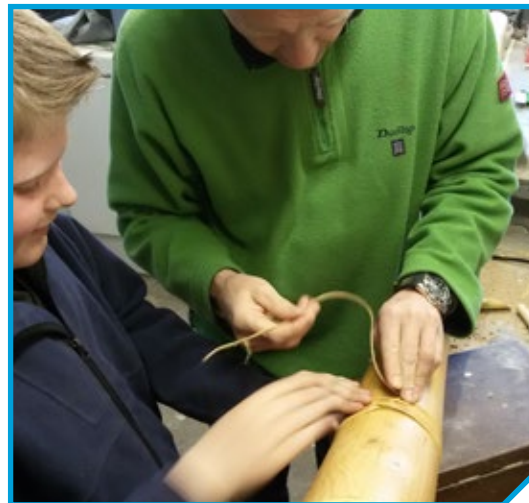
Met behulp van de provinciale steun kon extra gereedschap aangeschaft worden om meer kinderen les te geven in het maken van midwinterhoorns.