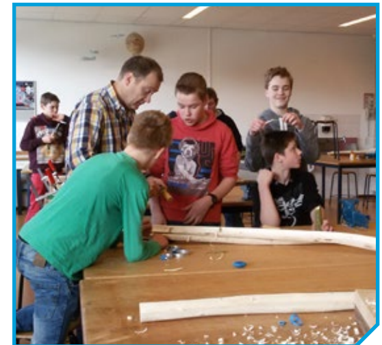
De kinderen luisteren aandachtig als ze uitleg krijgen van de meester-midwinterhoornmaker.