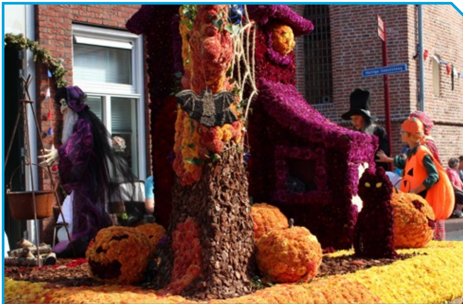
Het ontbreekt ook bij de kindergroepen niet aan de nodige fantasie, dat blijkt wel uit de praalwagens van de kindercorso. Hier de wagen Trick or Treat van de groep V-Power.

Er is nu ook een catwalk gebouwd waar de wagentjes overheen rijden en meer verlichting. De kinderen verkleden zich ook in kleding die bij het thema past. Na afloop zijn er prijzen en is er een wagenbouwersfeest, net als bij de grote corso. We hopen dat de kinderen zo sneller de stap naar de kindercorso en uiteindelijk de grote corso maken. Het is nu nog te vroeg om te zeggen of dat effect heeft, maar de frommelcorso is wel heel populair, ook bij de ouders en familieleden die komen kijken.