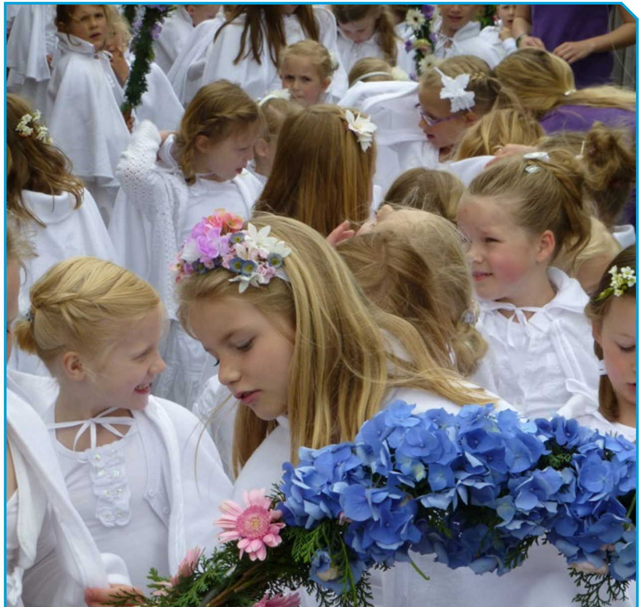
De Stichting Folkloregroep Borne is druk bezig met het vinden van een goede opslagruimte voor alle attributen van het festijn.

We zijn nog druk aan het brainstormen wat we nog meer gaan doen. Wel zijn we het erover eens dat we het evenement niet te commercieel willen maken en vooral kleinschalig willen houden. Niet té veel publiciteit dus. Het moet echt iets van Borne blijven.