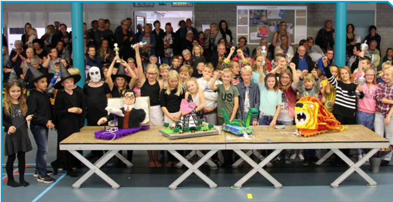
Voor de frommelcorso in Vollenhove werd vorig jaar een heuse catwalk gemaakt om alle creaties te vertonen.

De kindercorso wordt gehouden op de ochtend voor de corso en is voor kinderen vanaf twaalf jaar. Wij zijn de laatste jaren heel actief geweest in het promoten van de kindercorso. We werken samen met de zogenaamde Brede School in Vollenhove, waar de basisscholen onder vallen. Met een deel van de bijdrage van de provincie Overijssel hebben we zes nieuwe onderstellen kunnen kopen, die we gratis aan de kinderen beschikbaar stellen. We hebben ze ook gratis bloemen kunnen geven. De kinderen versieren op school een aantal wagens op basis van een thema. Hierdoor hebben er het afgelo-