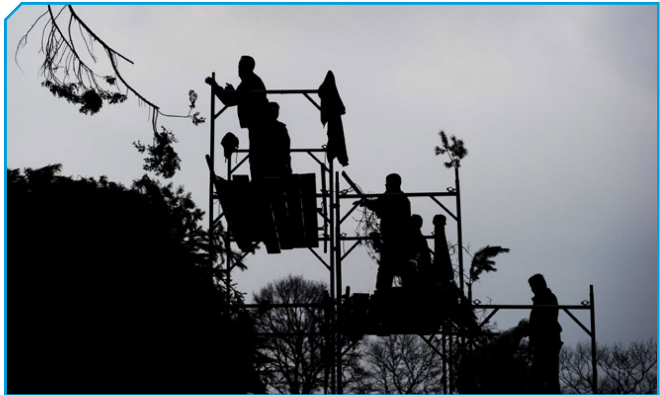
Kinderen leren van de ouderen hoe ze de houtstapel moeten opbouwen, alles gebeurt met de hand.

We beginnen in november al met het verzamelen van hout in gebieden van Staatsbosbeheer en Natuurmonumenten. Deze beide natuurverenigingen hebben ook ons erfgoedzorgplan mede-ondertekend. Daar moesten ze intern over stemmen en dat was nog wel een heikel punt, omdat grote vuren niet echt milieuvriendelijk zijn. Maar wij doen door het verzamelen van hout op heidevelden ook aan natuurbeheer en we hebben al heel lang een goede samenwerking, dus hebben ze ons toch gesteund.