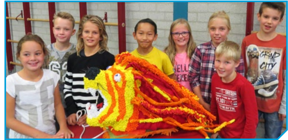
De winnaar van de frommelcorso 2016, de groep Power 2016 met The Lion King.

Wij begeleiden de beginnende jeugdgroepen ook met een eigen locatie waar ze kunnen bouwen, we houden daar toezicht, geven advies en hulp. We bieden ook een lascursus aan en ze mogen gereedschap gebruiken. Dat loopt wel goed. We zijn verder begonnen met de frommelcorso voor de hele jonge kinderen, ook samen met de Brede School. Daarvoor stellen we kleine wagentjes beschikbaar, die de kinderen versieren met propjes crêpepapier. We hadden de eerste keer een deel van de sporthal afgehuurd, maar er kwam zo veel publiek op af, dat we het volgende jaar de hele sporthal hebben gehuurd.