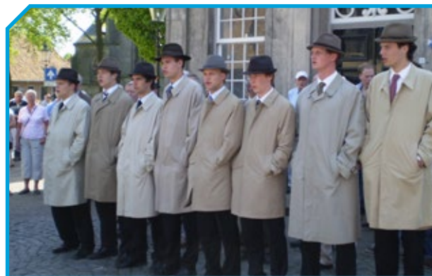
Eens een poaskearl, altijd een poaskearl. Sinds kort is er een Vriendengroep opgericht om het draagvlak onder de bevolking te vergroten.

De bijdrage van de provincie Overijssel kwam goed van pas. Bekendheid van de traditie is belangrijk voor het behoud en doorgeven. Medewerking en mee-denken van de gemeente komen onder meer voort uit de plaatsing op de Nationale Inventaris Immaterieel Cultureel Erfgoed. De traditie is belangrijk voor de gemeente, iedereen is er trots op. Met de bijdragen van de provincie hebben we de website compleet vernieuwd en er is een documentaire gemaakt van 20 minuten. De wagens voor het paashout staan sinds kort in het openlucht-museum Los Hoes Ootmarsum. De film wordt daarbij vertoond en een korte versie is beschikbaar voor de basisscholen.