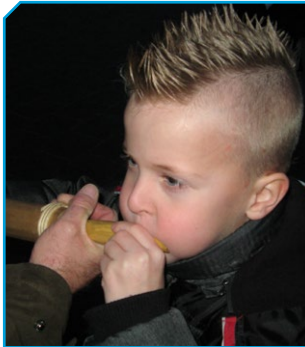
De stichting wil graag luisteren naar de inbreng van de jeugd.

Afgezien van de ROC's organiseren we zelf ook instructieavonden voor de jeugd. Afgelopen jaar werden er op vijf locaties door twee instructeurs tien lessen gegeven aan jongeren tussen veertien en achttien jaar. Een leuke bijkomstigheid is dat