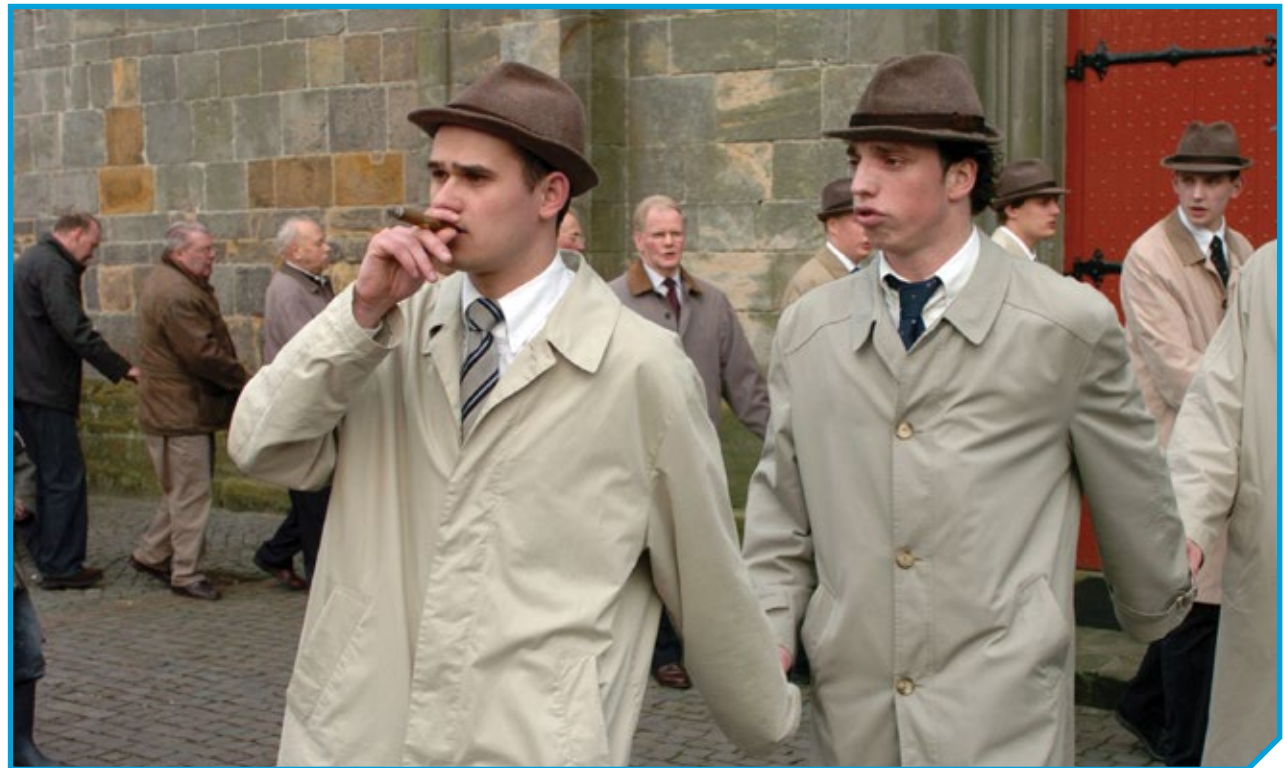
De geheimen van de traditie worden mondeling aan elkaar doorgegeven door de poaskearls. Het vinden van nieuwe poaskearls is gelukkig tot nog toe geen probleem.

Daarna begint om 17.00 uur het zogenaamde VlöggeIn. De poaskearls lopen dan hand in hand, geleid door de oudste poaskearl die een sigaar brandend moet houden. Ook wordt er