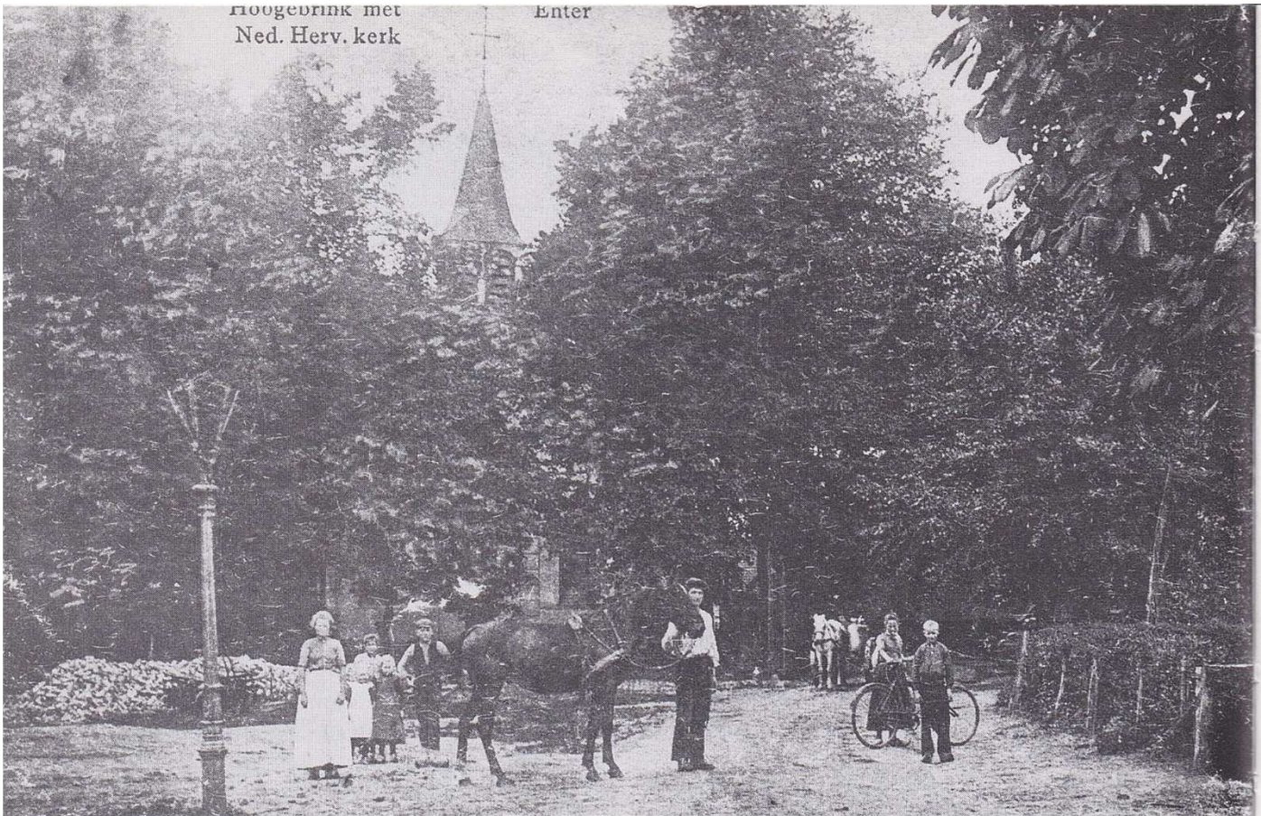
Van 't ganzenhoeden is geen foto bewaard gebleven dan die ene bekende uit de gids van H.W. Heuvel. Wel is hier een vertrouwd dorpsbeeld te zien uit die jaren. Op dit "plein" werden de ganzen samengedreven.

grootste deel uit onafogbare heidevelden, door oāsen van bebouwde akkers of hoog geboomte afgebroken.