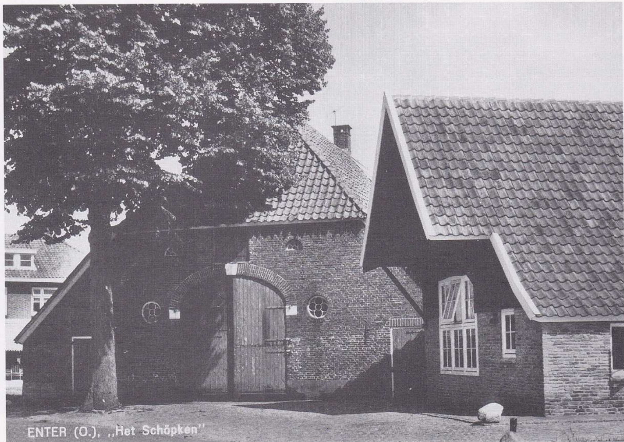
't Sköpke, nu klompenmuseum, vroeger een schuurtje bij de boerenwoning van de Zweersfamilie, voorheen Holleman, typerend voor 't boerenbestaan.

onbeantwoord terzijde en bracht ze ook niet ter sprake op de vergaderingen.