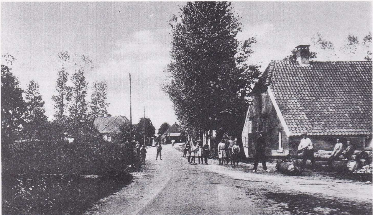
Van de weefschool is geen enkele foto meer terug te vinden. Des te meer foto's zijn bewaard gebleven van 't klompenmaken. Hier bij Homan aan de Gooseweg.